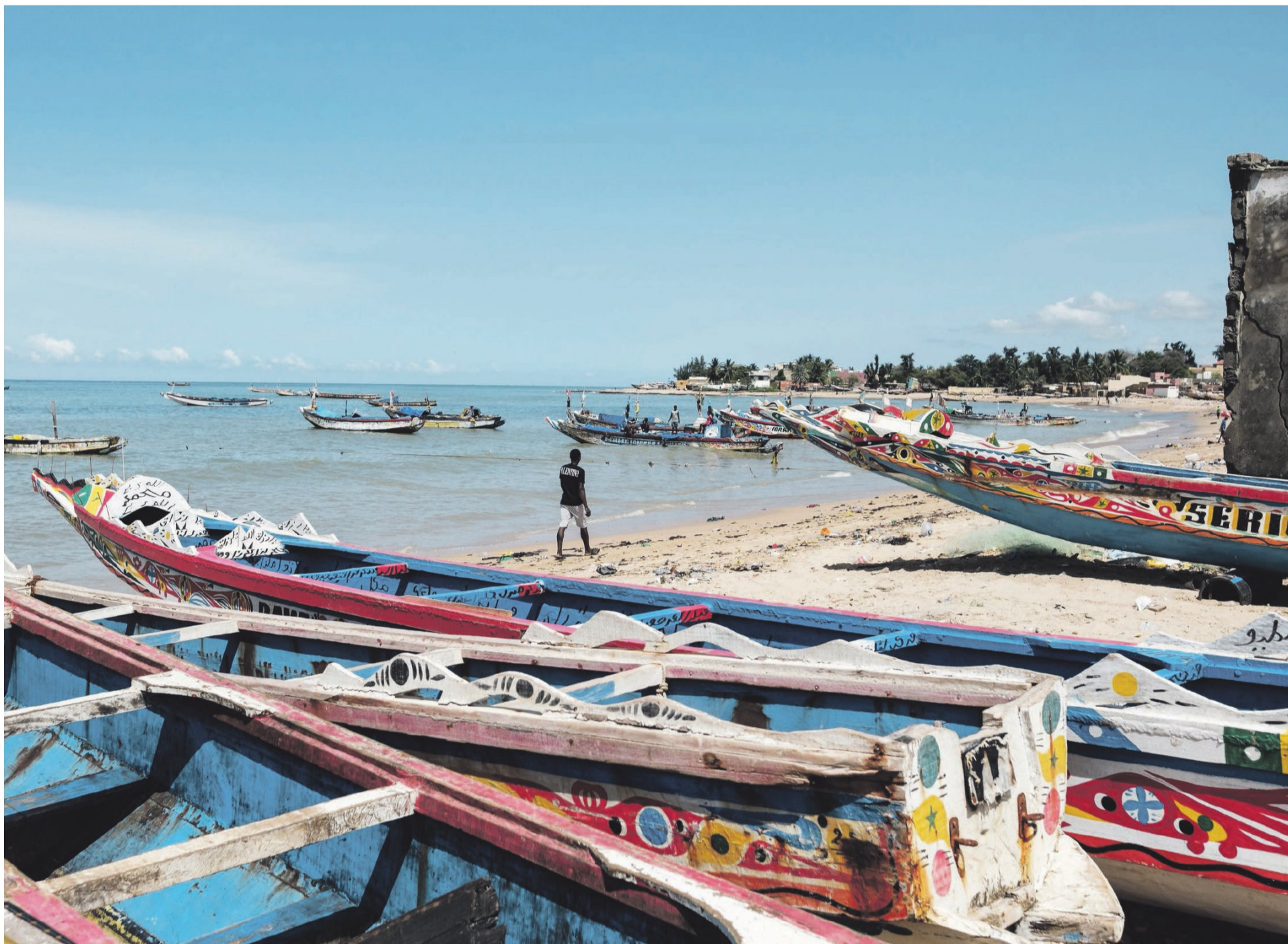
Vissersboten aan de kust in Mbour, aan de Petite Côte in Senegal. Ook vanuit dit dorp wordt de oversteek gemaakt naar de Canarische Eilanden.

SP-lijsttrekker Lilian Marijnissen vindt meer zeggenschap 'kneiterlinks'