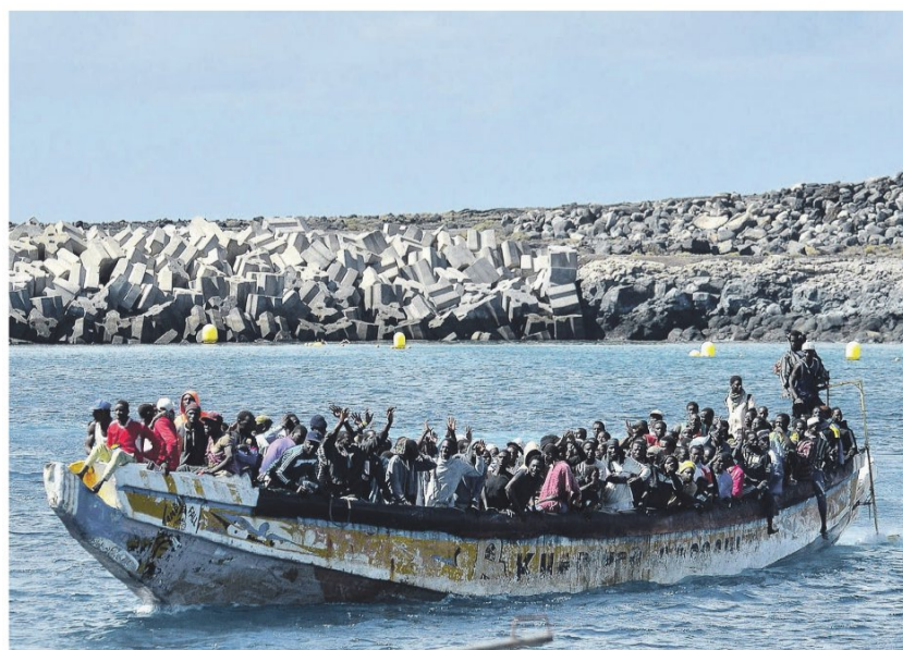
Een boot met migranten uit Afrika komt zaterdag aan op het Canarische Eiland El Hierro.

In zowel Spanje als Senegal krabben beleidsmakers zich achter de oren: waarom de Canarische Eilanden, en vooral: waarom nu? Vanaf het strand wijst Moussa Wade naar de oceaan. Voor het zoveelste jaar op rij viel het visseizoen in Mbour