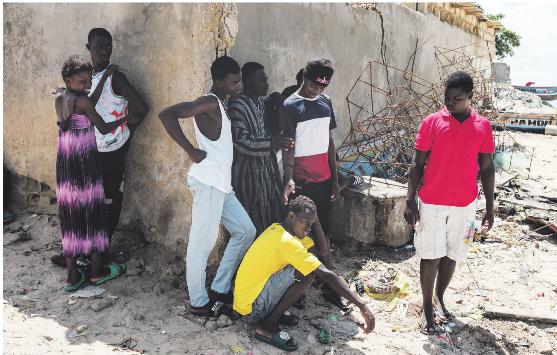
Jongeren staan bij een verlaten, door de zee aangetast gebouw in Mbour.